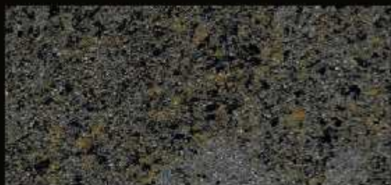
TN 07 FORTE