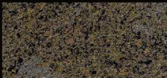
TN 025 FORTE