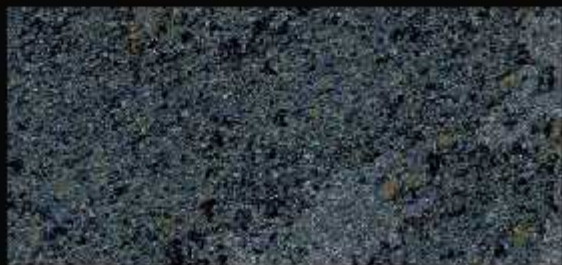
TN 021 FORTE