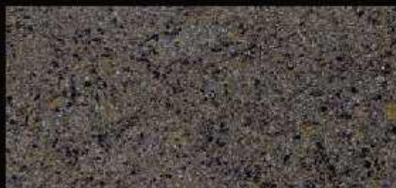
TN 08 CHIARO