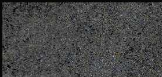
TN 07 CHIARO