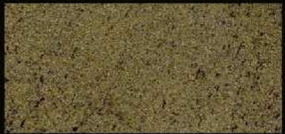
TN 026 CHIARO