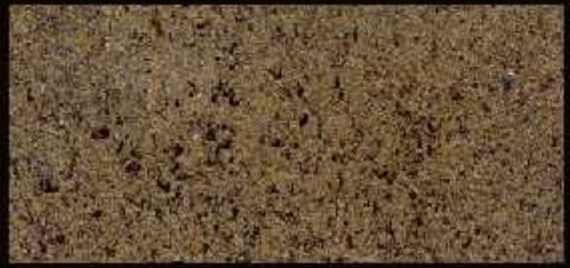
TN 024 CHIARO