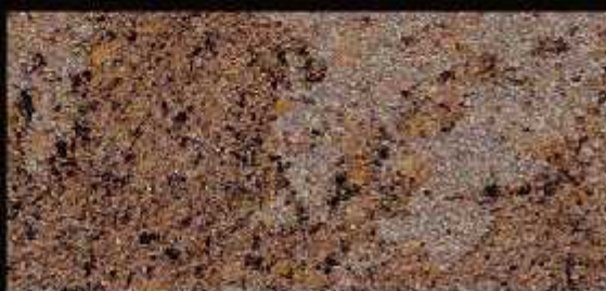
TN 020 FORTE