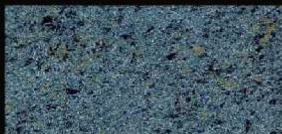
TN 022 FORTE