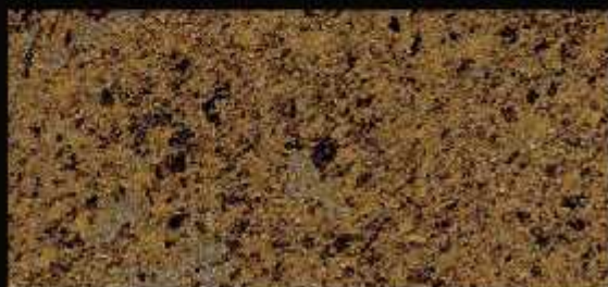
TN 01 FORTE