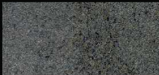
TN 026 CHIARO