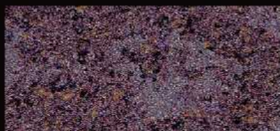
TN 023 FORTE