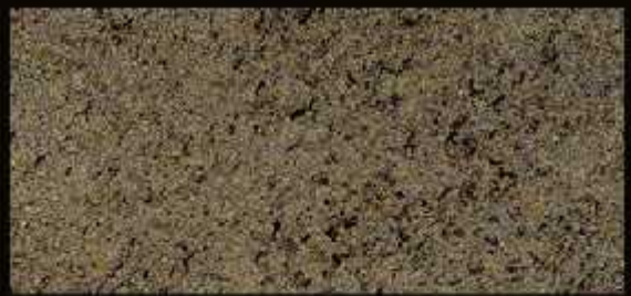
TN 02 CHIARO