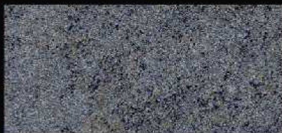
TN 02 CHIARO