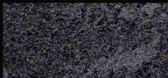
TN 019 FORTE