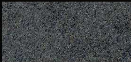
TN 021 CHIARO