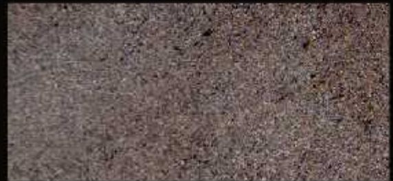
TN 09 CHIARO