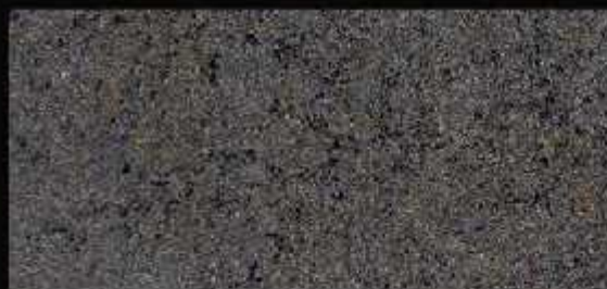
TN 06 CHIARO