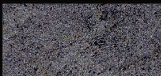
TN 024 CHIARO