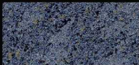
TN 02 FORTE