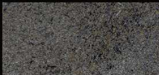
TN 025 CHIARO