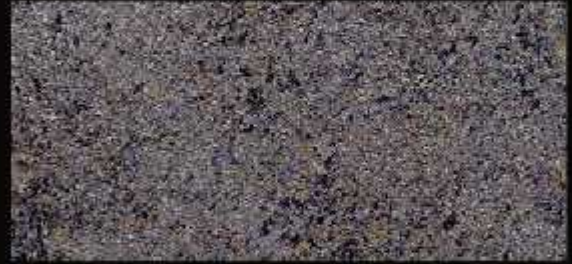
TN 05 CHIARO