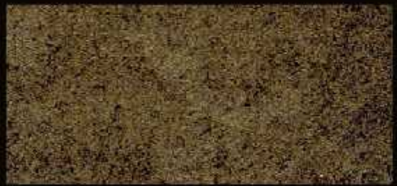
TN 019 CHIARO