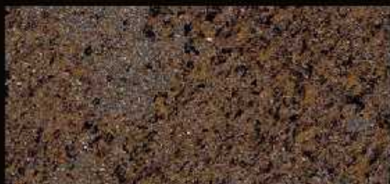
TN 08 FORTE