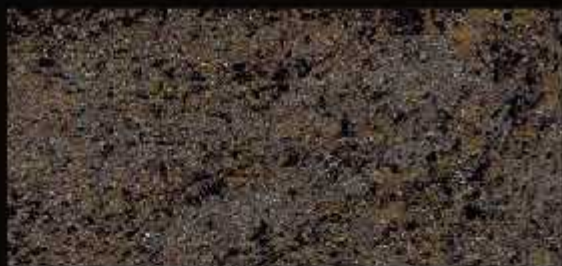
TN 06 FORTE