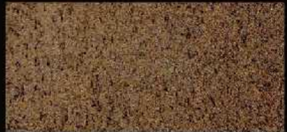
TN 023 CHIARO