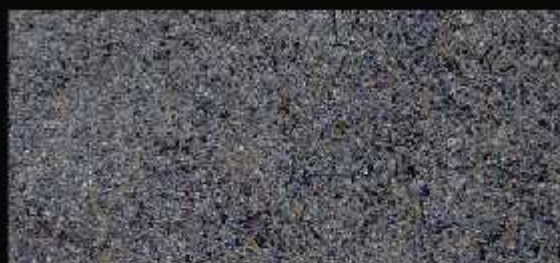
TN 019 CHIARO