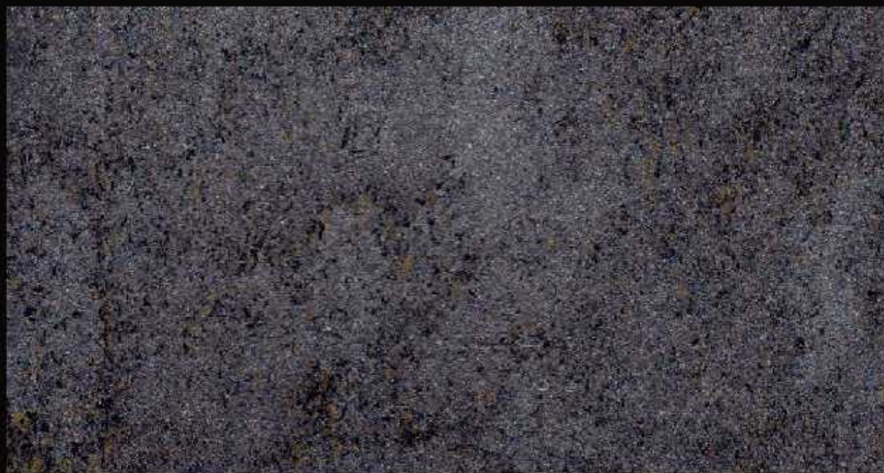
ROUGE ARGENTO TN 024 CHIARO