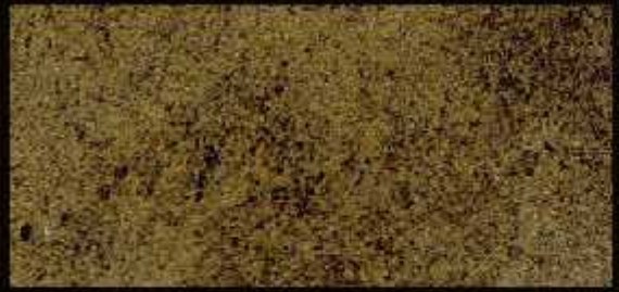
TN 025 CHIARO