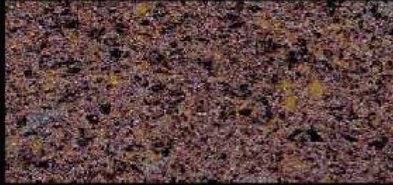
TN 05 FORTE