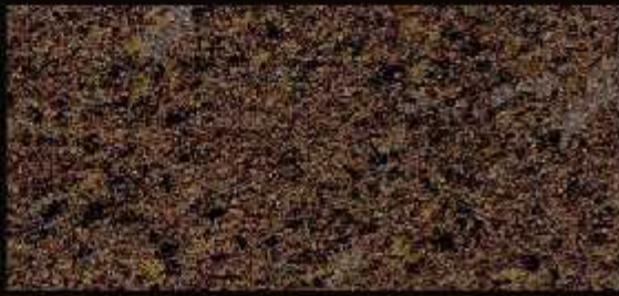
TN 024 FORTE