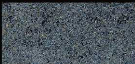
TN 022 CHIARO