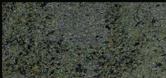
TN 026 FORTE