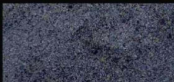
TN 118 CHIARO