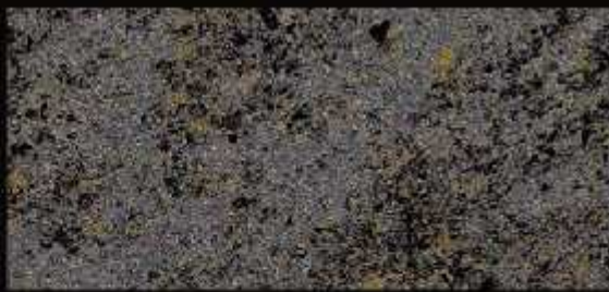
TN 02 FORTE