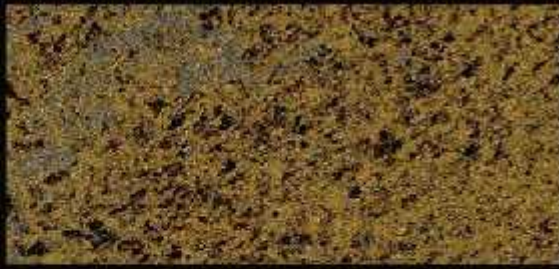
TN 025 FORTE