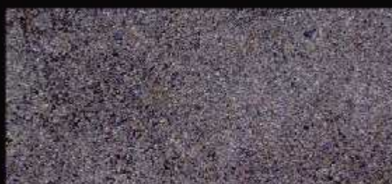
TN 023 CHIARO