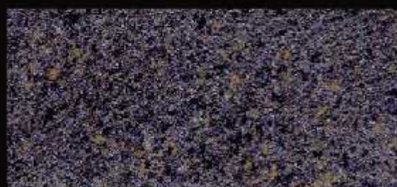
TN 024 FORTE