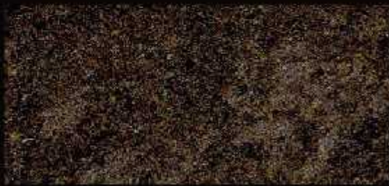
TN 019 FORTE