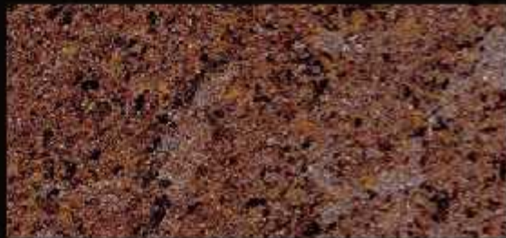
TN 09 FORTE