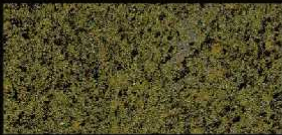
TN 026 FORTE