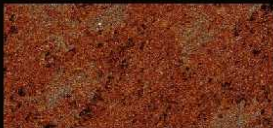
TN 03 FORTE