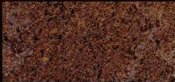
TN 023 FORTE