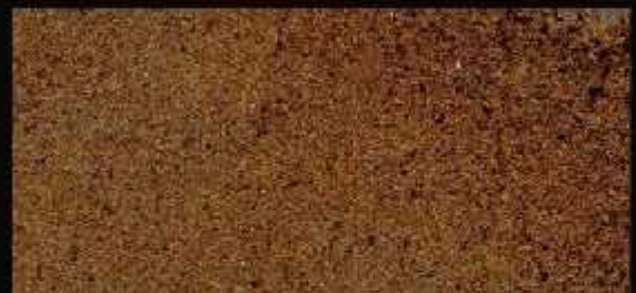
TN 03 CHIARO