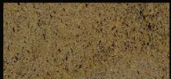
TN 01 CHIARO

A causa della natura tecnica dei coloranti, i campioni presenti sulla cartella sono puramente indicativi. Controllare sempre il campione del prodotto colore prima di procedere con l'applicazione. Due to technical nature of the colorants, displayed samples are purely indicative. Check samples of colorants before proceeding with application.