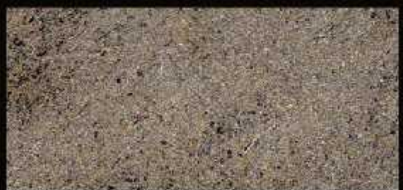
TN 020 CHIARO